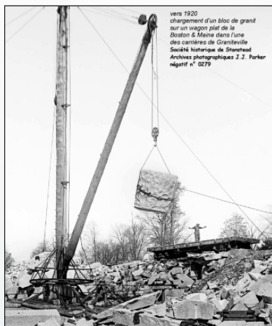
vers 1920 chargement d'un bloc de granit sur un wagon plat de la Boston & Maine dans l'une des carrières de Graniteville Société historique de Stanstead Archives photographiques J.J. Parker numéro n° 0279

Outre l'agriculture et l'exploitation forestière, l'activité commerciale la plus ancienne et toujours en cours à Ogden est l'extraction et la finition du granit. Peu d'habitants d'Ogden mesurent l'ampleur du rôle essentiel que l'industrie du granit a joué dans l'économie locale pendant plus d'un siècle. Patrimoine d'Ogden souhaite changer cela en organisant une célébration de l'industrie du granit d'Ogden à l'été 2026. Tout le monde sera le bienvenu et nous recherchons des bénévoles pour aider à la réalisation de ce projet.