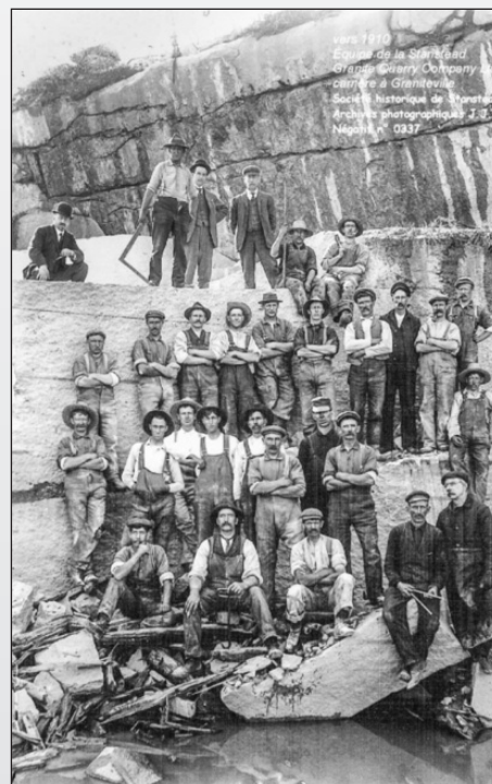
vers 1910 Équipe de la Stanstead Granite Quarry Company à Graniteville numéro n° 0337

Restez à l'écoute de la Chronique d'Ogden et de notre site Web ( www.heritageogden.ca ) pour connaître les détails définitifs de nos projets de célébration. Pour plus d'informations sur l'industrie locale du granit, consultez la section affiches du site Web, la brochure « Nature et temps jadis », ou visitez l'exposition en plein air au belvédère de la carrière.